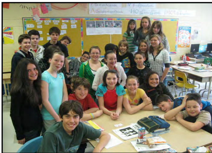
Classe gagnante du concours...